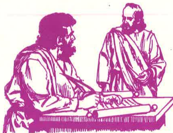
"Lucas Escribiendo el Libro de Los Hechos."

Teniendo en cuenta la eternidad de nuestro espíritu, es de vital importancia que todos nosotros expe-