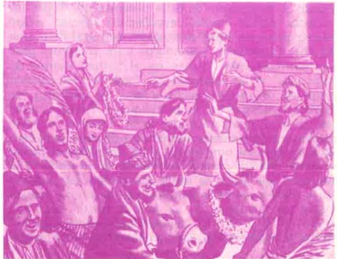
"El sacerdote de Júpiter les quería hacer sacrificios."

(Lea Hechos 14:14-18). En el versículo 14, donde dice: "Cuando lo oyeron ", se sobreentiende que Lucas quiere decir "cuando se dieron cuenta ". Ya que, al parecer, no entendieron lo que decía la gente en lengua licaónica, también es posible que alguien, por fin, les explicara en griego el significado de los gritos de la multitud. En ese momento, los apóstoles "rasgaron sus ropas", gesto de los judíos que servía para demostrar su asombro, horror y disgusto ante el intento de la gente de ofrecerles sacrificios. Insistieron en que eran seres humanos igual que ellos y se empeñaron en que dejaran tales pensamientos vanos y hasta absurdos. Ellos mostraban la misma humildad que mostró Pedro en la casa de Cornelio (Hechos 10:25-26).