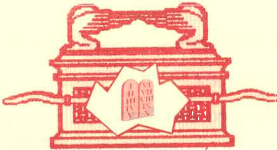
Palabra de Dios Dentro del Arca

7. Así que, bien se puede decir que no era suficiente poner algunas de las palabras de Dios dentro del arca, ni poner otras palabras de Dios al lado del arca. Antes bien, como dice Deuteronomio 11:18, Dios mandó al pueblo de Israel poner las palabras de El dentro de su _____ y su _____.